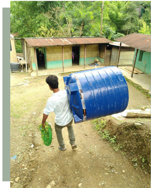
Mandelzweig-Projektleiter e.V. - August 2024

Am 01. August 2024 wurden die beiden Wassertanks angeliefert und installiert. Auf diesem Bild sieht man die Klassenräume der Vorschulkinder. Sie haben den kürzesten Weg zur Sanitieranlage, die links neben ihren beiden Klassenräumen entstehen.