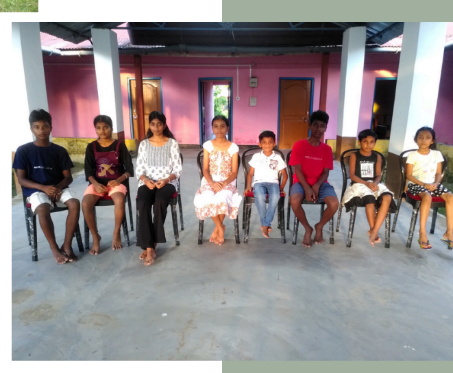
Mandelzweig-Projekthilfe e.V. - August 2024